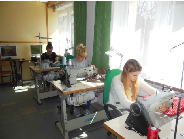
Szkolna pracownia krawiecka

Jeśli lubisz zabawę z modą, chcesz nauczyć się szyc, projektować ciekawe i oryginalne kreacje a może interesuje Cię przemysł mody, dołącz do nas, a my pomożemy Ci w realizacji twoich pasji.